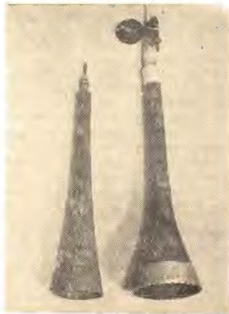
Փոքր զուռնա, Այրարատ Մեծ զուռնա, Համշեն

Բացի վերոհիշյալ տիպերից, նորնախիչևանցիների կենցաղում օգտագործվում է նաև էրո-