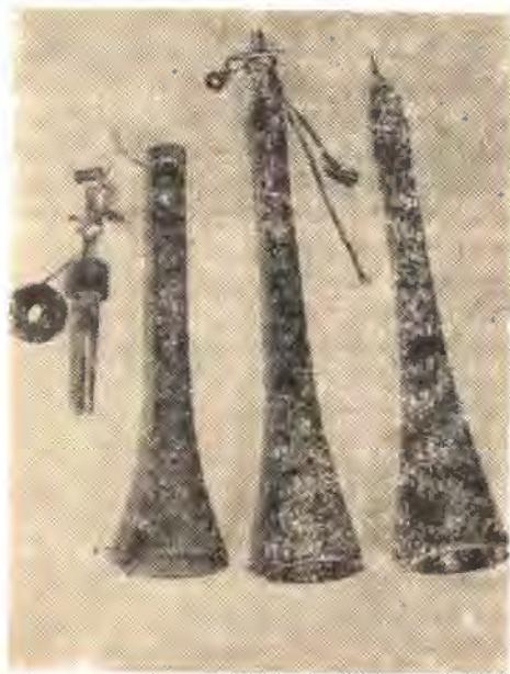
Փոքր զուռնաներ, XIX—XX դդ.