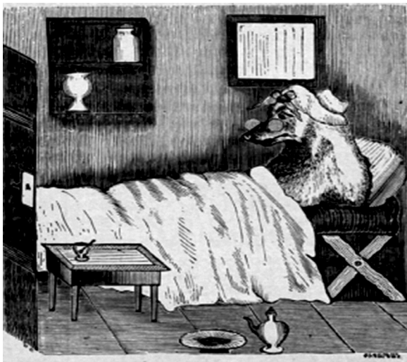
Նկ. 2: Հակոբ Պարոնյանի «Կարմիր վարդուկը» հեքիաթին կցված նկարը («Թատրոն. բարեկամ մանկանց», կիսամյա պատկերագրող հանդես, Կ. Պոլիս, 1876, N 2)

Այլ է խնդիրը Հակոբ Պարոնյանի պարագայում. նրա մանկագրական ժառանգության և առհասարակ հայ մանկագրության համապատկերում իր ուրույն տեղն է զբաղեցնում «Կարմիր վարդուկը» հեքիաթը: «Կարմիր գլխարկի» տարբերակներից ու մշակումներից ընտրելով Շառլ Պերրոյի վատ ավարտ ու էրոտիկ բացահայտ բովանդակություն ունեցող հեքիաթը՝ հեղինակը փորձում է այդ վերջաբանի ազդեցության և վախի ներգործության միջոցներով խրատել իր մանուկ ընթերցողներին՝ առաջնային պլանում դնելով ձիշտ դաստիարակության դերը: Դրանով հանդերձ, սակայն, չի տուժում նաև գործի գեղարվեստական կողմը: Պահպանելով հիմնական գծերը, դիպաշարն ու կերպարները՝ նա հարմարեցնում է ստեղծագործությունը հայ մանկան ճաշակին ու հոգեբանությանը: Հ. Պարոնյանը մատը դնում է կենսական երկու երակների վրա՝ լեզվառձական