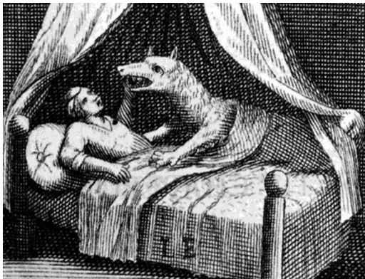
Նկ. 1: Շառլ Պերրոյի «Կարմիր գլխարկը» հեքիաթի առաջին հրատարակությանը կցված նկարը (Charles Perrault, Histoires ou Contes du temps passé , Paris, 1697)

Այս խորհրդանիշների ներքին բովանդակությունն ավելի է ամրակայվում դիպաշարային տարբեր դրվագներում , որոնք ևս ունեն սեռական քողարկված բնույթ: Գալով տատիկի տուն՝ կարմիր գլխարկը գայլի հորդորով հանում է իր զգեստները և մտնում անկողին, որտեղ էլ զարմանում է՝ տեսնելով տատիկի (գայլի) մերկությունը. «Փոքրիկ Կարմիր գլխարկը հանեց հագուստները և բարձրացավ անկողին, որտեղ շատ զարմացավ՝ տեսնելով՝ ինչ տեսք ունի իր տատիկը մերկացած» 4 : Այդ զարմանքից էլ ծնվում են աղջկա հարցերը՝ ուղղված գայլին: Կարմիր գլխարկին նվիրված իր մենագրության մեջ գրականագետ Քեթրին Օրենսթեյնը սեռական շեշտադրում է տեսնում նաև առաջին հարց-պատասխանի մեջ,