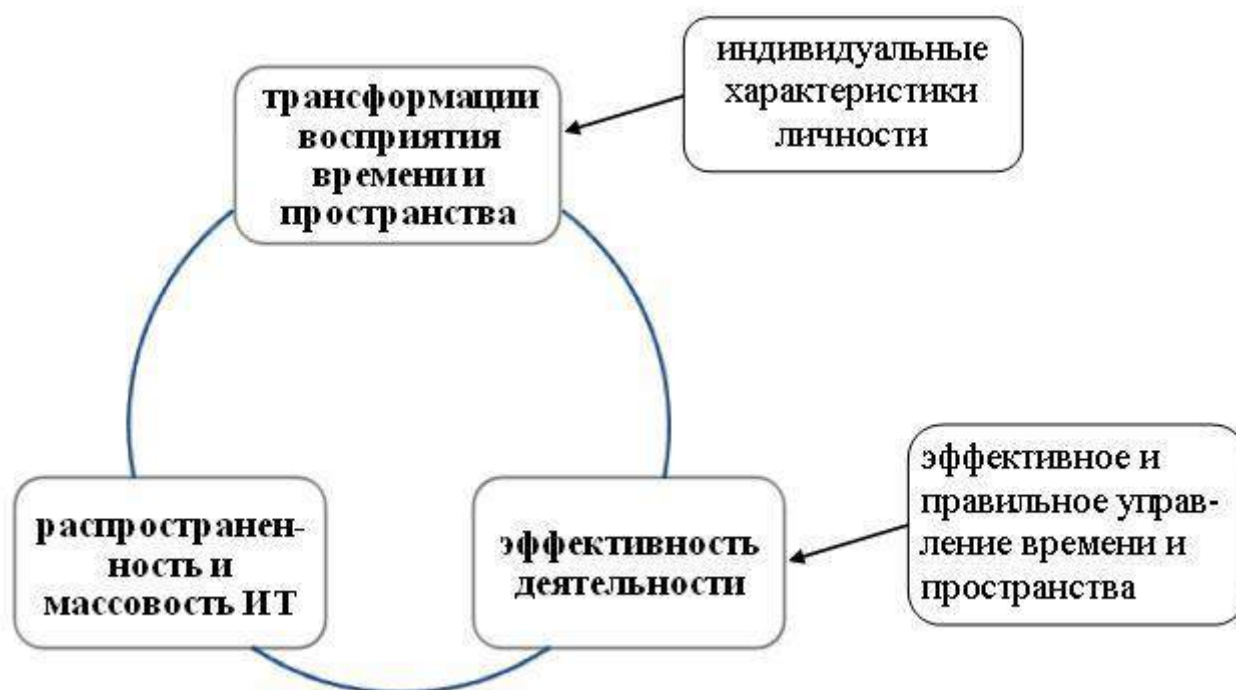
Рисунок 2. Схема цепочки зависимости процессов трансформации восприятия времени и пространства от степени распространенности ИТ и индивидуальных характеристик личности

Проведенный теоретический анализ проблемы трансформации восприятия времени и пространства в современном мире, ее влияние на эффективность деятельности, а также ее обусловленность различными индивидуальными характеристиками показал, что, несмотря на тенденции исследования этой проблемы в различных дисциплинах, имеющиеся исследования не дают целостного представления о причинах и следствиях данной проблемы. В тоже время, учитывая, интенсивность и продолжительность преобразований в сфере ИТ, а также влияние этих преобразований на эффективность деятельности, опосредованное психическим и физическим здоровьем человека, ставит задачу проведения систематических научных мониторингов, способствующих профилактике нежелательных проявлений ситуационной адаптации личности, тем самым способствуя повышению уровня эффективности профессиональной деятельности.