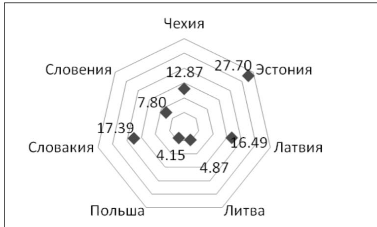
Рисунок 5. Страны с высоким уровнем конституционализма

В контексте упомянутой кластеризации наибольшую важность получили индикаторы свободы высказываний и убеждений, избирательного процесса и правового показателя. Они в порядке убывания важности представлены ниже.