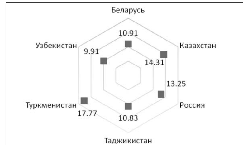
Рисунок 3. Страны с низким уровнем конституционализма

Применив кластерный анализ описанным выше способом мы получили три группы стран, представленные на следующих трех рисунках. На этих рисунках вместе со странами, включенными в данную группу, представлены также их удаленность от центра данного кластера, рассчитанного с помощью евклидова расстояния.