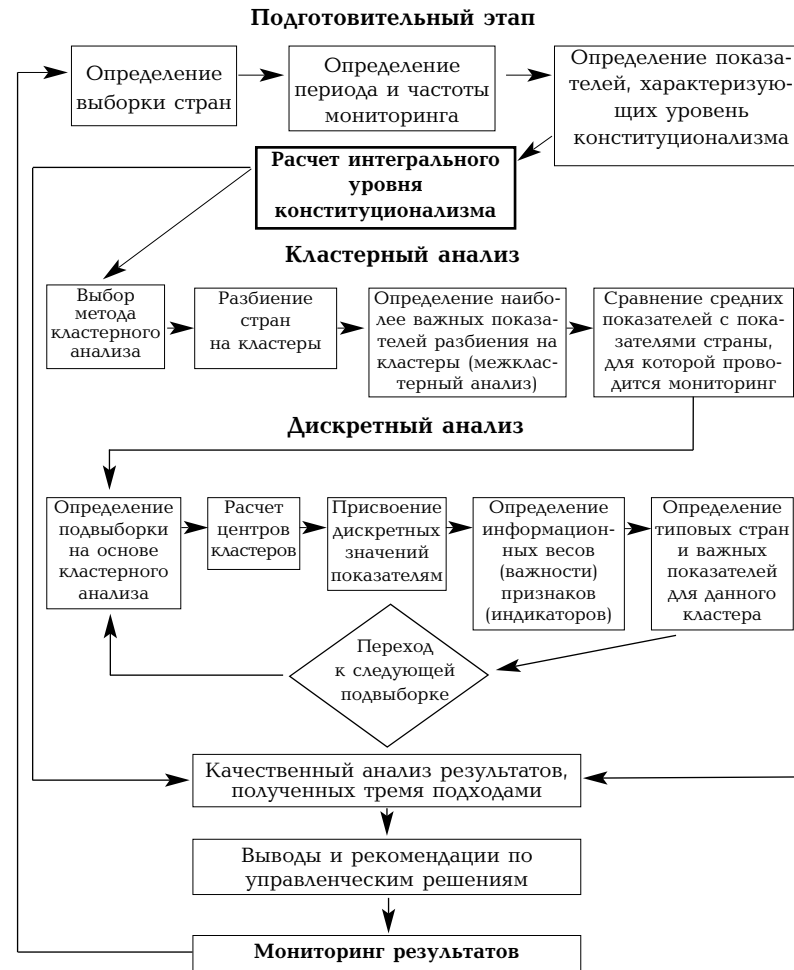
Рисунок 2. Концептуальная схема проведения мониторинга конституционализма на основе моделирования и сравнительного анализа

На последнем этапе исследования результаты, полученные тремя независимыми методами "совмещаются" и проводится качественный анализ с вытекающими выводами.