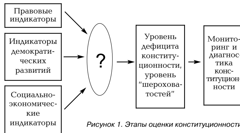
Рисунок 1. Этапы оценки конституционности

Оценку конституционализма можно представить как направленный на уточнение размера существующих шероховатостей, дефицита и провалов конституционализма процесс, на основе которого осуществляется мониторинг экономико-правовых процессов и управление ими. Этапы оценки конституционности приведены на следующем рисунке: