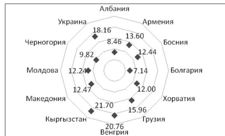
Рисунок 4. Страны со средним уровнем конституционализма