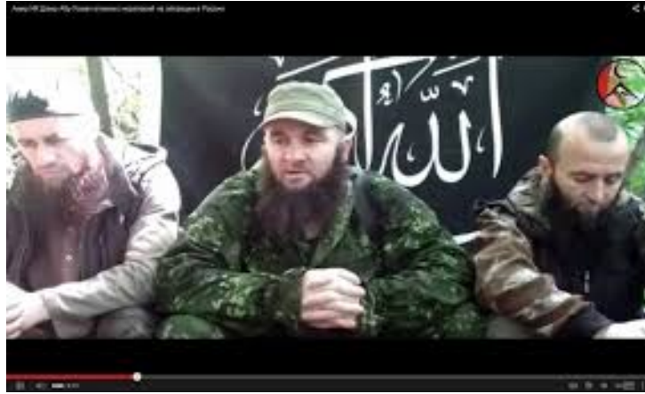
Դոկու Ումարով (Աբու Ուսման, սպանվել է 2013 թ. սեպտեմբերի 7-ին Դադստանում)

2008 թ. հուլիսին «Կովկասի Էմիրության» տեղեկատվության ծառայության ղեկավար Մովլադի Ուդուգովը տեղեկություն տարածեց, որ հայտարարված պետությունը («Կովկասի Էմիրությունը») զուրկ է սահմաններից, և սխալ է խոսել այն մասին, որ հյուսիսկովկասյան մի քանի հանրապետություններում նպատակ է դրված ստեղծել ինչ-որ կղզյակ: Հիշյալ տարածքների և Ռուսաստանի տարբեր տարածաշրջանների շատ մուսուլմաններ հավատարմության երդում են տալիս Դոկու Ումարովին՝ որպես մուսուլմանների օրինական առաջնորդի 64 : Այդ ժամանակահատվածից արդեն արձանագրվեց իսլամական ծայրահեղ արմատական տրամադրությունների աճ Կովկասում, նկատվեցին հակառուսական պայքարի նոր կարգախոսներ: Առաջին պլան