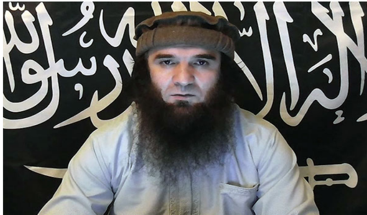
Ալի Աբու Մուհամմադ (Ալխսհակ Կեբեկով. սպանվել է Ռուսաստանի Բույնակսկում 2015 թ. ապրիլի 19-ին)

թյան» նոր էմիր 73 , որով և հաստատվեց Դոկու Ումարովի սպանվելու փաստը: