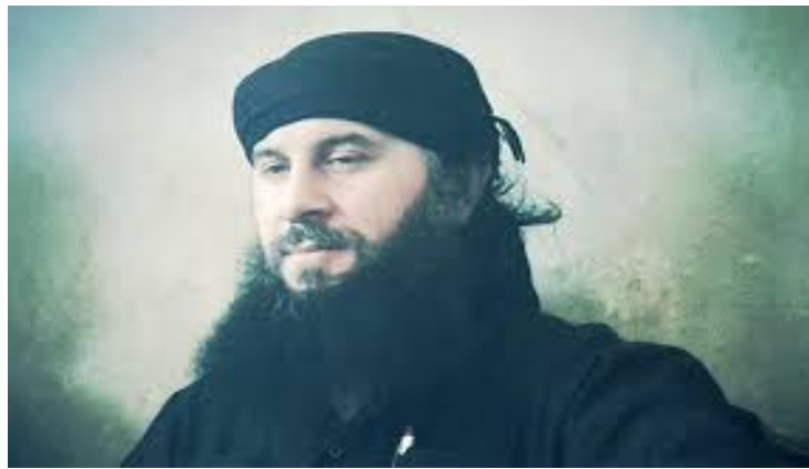
«Գովկասի Էմիրությունը» ներկայացնող Սալահ ադ-Դին ալ-Շիշանի