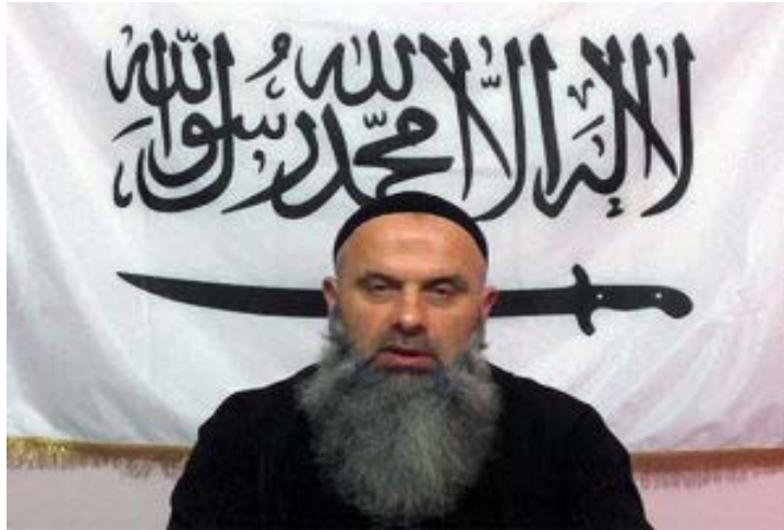
Չեչնիայի վիլայեթի առաջնորդ Աբու Համգա

րաբերյալ: Հիշյալի ապացույցն է «Չեչնչայի վիլայեթի» առաջնորդ Աբու Համգայի կողմից տարածված հայտարարությունն առ այն, որ կան հակասություններ կովկասյան իսլամականների շրջանում, և պետք է խորհուրդ հրավիրել էմիր և դատավոր ընտրելու համար 83 :