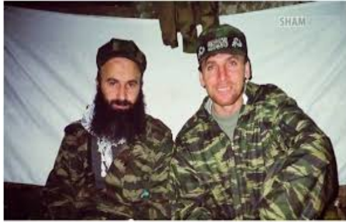
Շամիլ Բասան և Մուսլիմ ալ-Շիշանի