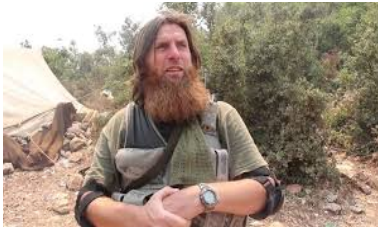
Մուսլիմ ալ-Շիշանին (Ամիր Մուսլիմ)