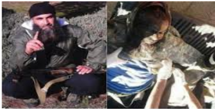
Musab al-Azeri, before and after death

Աբու Յահյա ալ-Ազերիի սպանությունից հետո ադրբեջանական ջիհադականների ղեկավարությունը ստանձնեց Մուսաբ ալ-Ազերին (Մուսաբ Աբդ ալ-Ռահիմ Աբդ ալ-Մաջիդ), ով 12 այլ ադրբեջանցիների հետ միասին սպանվեց քրդական զինված ստորաբաժանումների կողմից 2014 թ. մարտին: