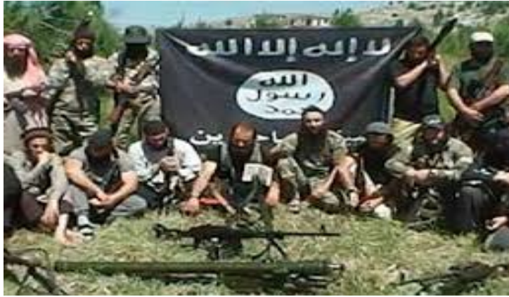
Ադրբեջանցվի իսլամականները Միրիայից սպառնում են ալիևյան վարչախմբին