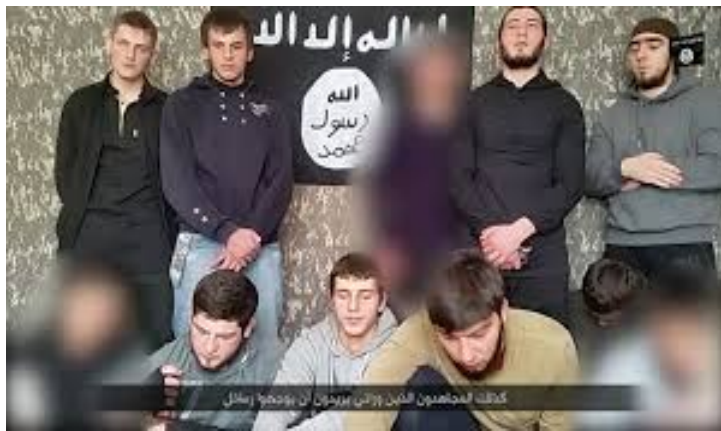
Մի խումբ կովկասցի իսլամականներ սպառնում են Ռուսաստանին

կան ծայրահեղական խմբավորումն այդ շրջափուլում արդեն ակտիվ գործունեություն էր ծավալում ոչ միայն Ռուսաստանի հարավային շրջաններում, այլ ներգրավված էր մերձավորարևելյան տարածաշրջանում իրականացվող ջիհադական պայքարում՝ հարելով այստեղ ակտիվություն ցուցաբերող իսլամական ծայրահեղական ուժերին՝ հատկապես այդ ժամանակ դեռևս «ալ-Կաիդա»-ի ճյուղավորում ԻՇԻՊ-ին: Վերջինիս դրոշի առկայությունը Վոլգոգրադի ահաբեկչությունն իրականացրած իսլամականների տեսանյութում փաստեց կովկասյան իսլամական ծայրահեղական որոշ ուժերի «ալ-Կաիդա»-ին հարելու և ջիհադական պայքարի համընդհանուր մարտավարությանը հավատարիմ մնալու մասին: