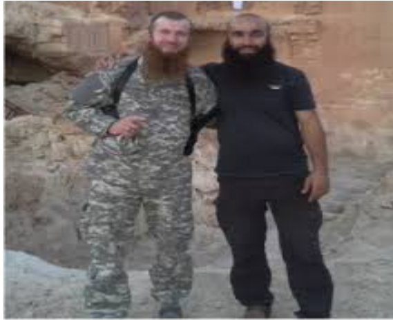
Աբու Ումար ալ-Շիշանի և Աբու Յահյա ալ-Ազերի