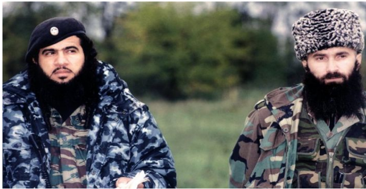
Խատար (Սամիր Սալիհ ալ-Մուայլիմ. սպանվել է Ռուսաստանի Չեչնիայում 2002 թ. մարտի 20-ին) և Շամիլ Բասան (Աբու Բդրիս. սպանվել է Ռուսաստանի Ինգուշեթիայում 2006 թ. հուլիսի 10-ին)

կան արմատականությունն ակտիվ դերակատարում ունեցավ: Բացի տեղի իսլամականներից, ակտիվ էին նաև այլ երկրներից եկած իսլամականները: Վերջիններից աչքի ընկան հորդանանցի Ֆաթի Մուհամեդ Հաբիբը (Աբու Մայյաֆ) և սաուդցի Սամիր Ալ-Մուվայլիմը (Խատար): Աբու Մայյաֆը, որն ուներ աֆղանական պատերազմի մասնակցության փորձ, 1992 թ. ժամանեց Չեչնիա, որտեղ բացեց իսլամական դպրոց և սկսեց իրականացնել որոշակի գործունեություն: 1995 թ. Չեչնիա ժամանեց նաև Խատարը, որի հետ՝ նաև մեծ թվով իսլամականներ: Նրանք հետագայում ակտիվ մասնակցեցին Չեչնիայի ջիհադական պայքարին: Խատարն ու չեչեն դաշտային հրամանատար Շամիլ Բասանը սկսեցին աշխատել օտարերկրյա մարտիկներին չեչենական ջիհադին մասնակից դարձնելու հնարավորությունների ստեղծման ուղղությամբ: