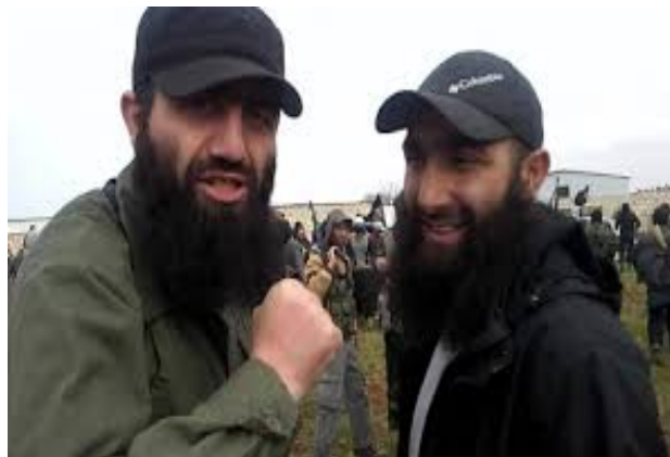
Մայֆուլլահ ալ-Շիշանի և Աբու Յահյա ալ-Ազերի