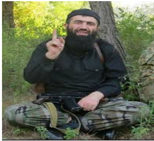
Սայֆուլլահ աշ-Շիշանին. (սպանվել է Սիրիայի Հալեպ քաղաքի մոտ 2016 թ. փետրվարի 6-ին)

Կովկասցի իսլամականները աչքի ընկան ոչ միայն որպես շարքային զինյալներ, այլ նաև որպես զանազան խմբավորումներ ղեկավարող հմուտ հրամանատարներ և հեղինակավոր առաջնորդներ, որոնց փորձն օգտագործվեց Սիրիայի և Իրաքի տարբեր հատվածներում իրականացվող ջիհադում: Նրանցից հայտնի են Աբու Ումար աշ-Շիշանին (Թարքան Բաթրիաշվիլի, սպանվել է 2016 թ. հունիսին: Նրա մասին խոսվում է մենագրության երրորդ գլխում), Սայֆուլլահ աշ-Շիշանին (սպանվել է 2016 թ. փետրվարի 6-ին Հալեպի մոտ), Մուսլիմ ալ-Շիշանին (Ամիր Մուսլիմ), «Կովկասի էմիրությունը» ներկայացնող Սալահ ադ-Դին աշ-Շիշանին և այլք: