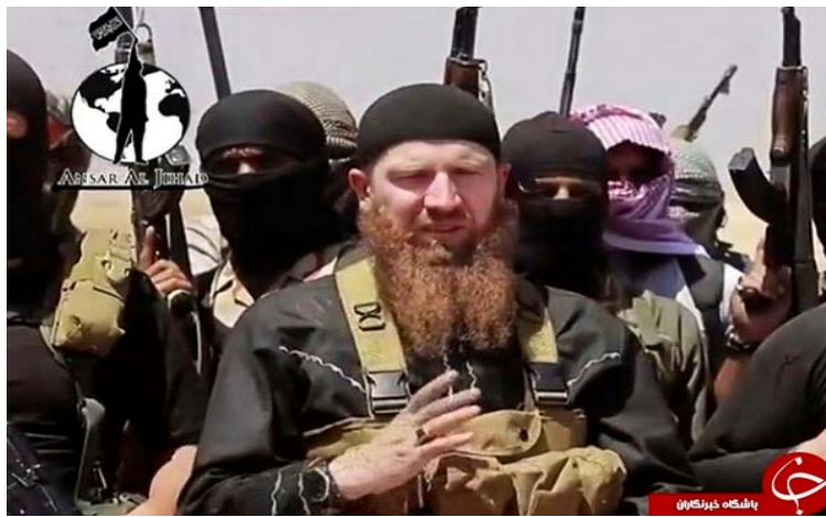
Աբու Ումար ալ-Շիշանի (Թարխան Բաթիրաշվիլի. սպանվել է Իրաքի Մոսուլ քաղաքի շրջակայքում 2016 թ. հունիսին)

Մերձավոր Արևելքում տեղի ունեցող ջիհադական պայքարում Վրաստանը նույնպես ունեցել է ներկայացուցիչներ: Ըստ որոշ տեղեկությունների՝ Սիրիայում և Իրաքում ծայրահեղ արմատական խմբավորումների շարքերում կռվող իսլամականներից 200-ը հենց Վրաստանից էին 139 : Բացի դա, «Իսլամական պետության» առանցքային առաջնորդներից Աբու Ումար ալ-Շիշանին (Թարխան Բաթիրաշվիլի) ծնունդով Վրաստանի Պանկիսի կիրճից էր: Նա կարճ ժամանակում դարձավ «Իսլամական պետության» Կովկասը ներկայացնող առանցքային առաջնորդներից մեկը: