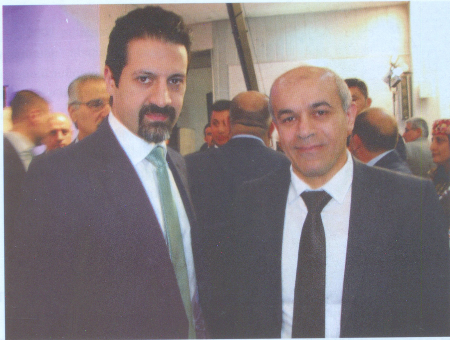
Քուրդիստանի ռեզիստնալ կառավարության փոխվարչապետ Քուբաթ Թալարանին և Վահրան Պետրոսյանը