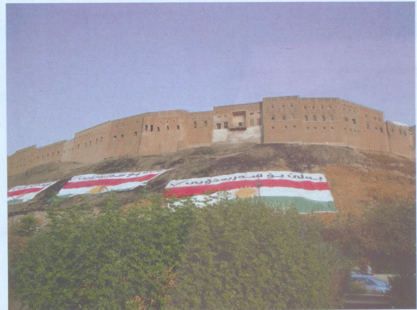
ՔՌ-Կ մայրաքաղաք Էրբիլը (2017)