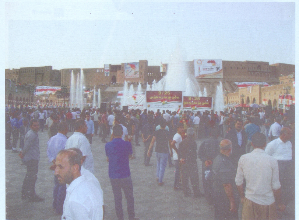
Էրբիլ (սեպտեմբերի 25, 2017)