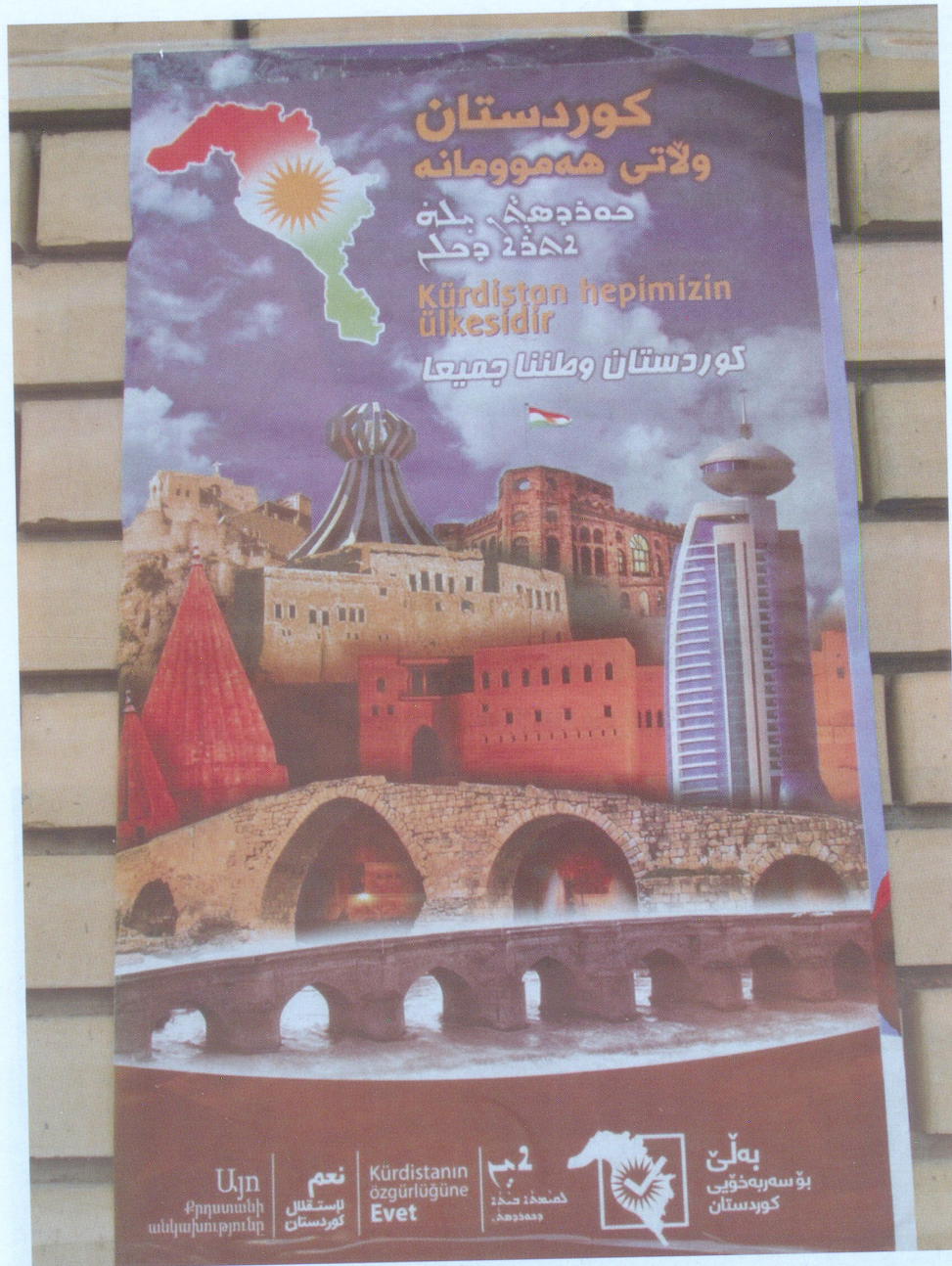
2017 թվականի սեպտեմբերի 25-ի անկախության հանրաքվեի գովազդային պաստառներից