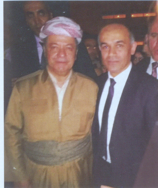
Վահրամ Պետրոսյանը Քուրդիստանի նախագահ Մասուդ Բարզանու հետ